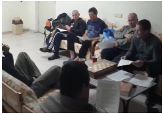
Библейский урок в ребцентре