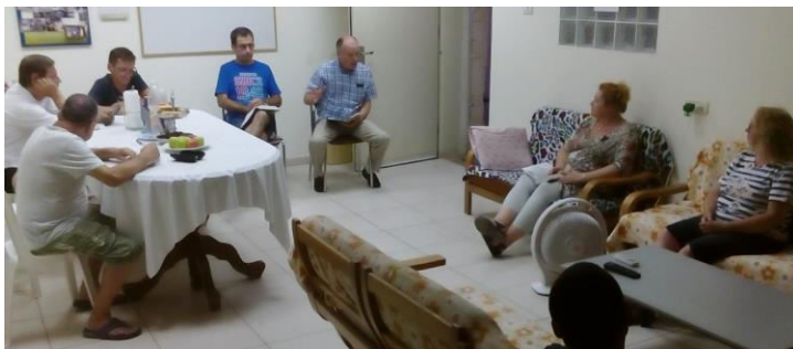
Библейский урок в беершевском ребцентре

Тем не менее все, кто у нас побывали, слышали Евангелие, пожили в христианском доме и теперь знают, где смогут нас найти, если решат возобновить программу. Фактически, мы видим, что даже несколько дней в ребцентре не проходят даром для наркоманов. Когда мы встретили одного из наших бывших подопечных в беершевском парке, о котором я писал выше, он с радостью узнал нас и тепло отзывался о нас перед своими друзьями. Он даже сказал, что думает вернуться и закончить программу. Пожалуйста, молитесь за него.