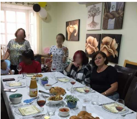
Sabbatviering in de vrouwen opvang