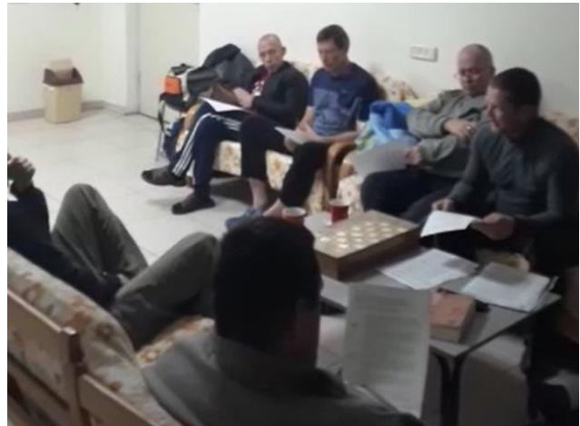
Bibelstunde im Reha-Zentrum