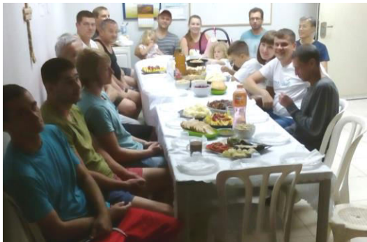
Rehabilitants and Bible teachers at a meal

Wir sind dem Herrn dankbar, dass zwei weitere Männer unser Rehabilitationsprogramm beendet haben und in ein unabhängiges Leben zurückgekehrt sind. Das bedeutet, dass kürzlich insgesamt fünf Rehabilitanden unsere „Absolventen“ geworden sind. Wir pflegen weiterhin den Kontakt zu ihnen. Bitte denken Sie weiterhin ebenso an sie im Gebet.