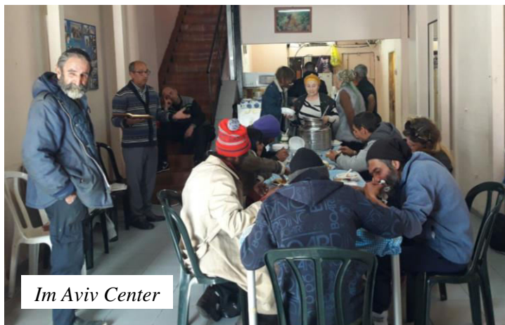
Im Aviv Center