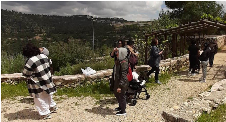
Die Frauen aus dem Frauenhaus und freiwillige Helfer bei einem Ausflug.

Bitte beten Sie weiter für das Frauenhaus, für die Frauen und Kinder darin und für das Team der Mitarbeiter und Ehrenamtlichen. Zurzeit leben vier Frauen und drei Kinder im Frauenhaus (zwei Frauen, die etwa ein halbes Jahr bei uns gelebt haben, sind ausgezogen, um andere Ziele zu verfolgen). Aufgrund von traumatischen Erfahrungen kamen Sie alle zu uns in einem denkbar schlechten Zustand. Doch jetzt sehen wir sie Lächeln und hören ihr Lachen, sie