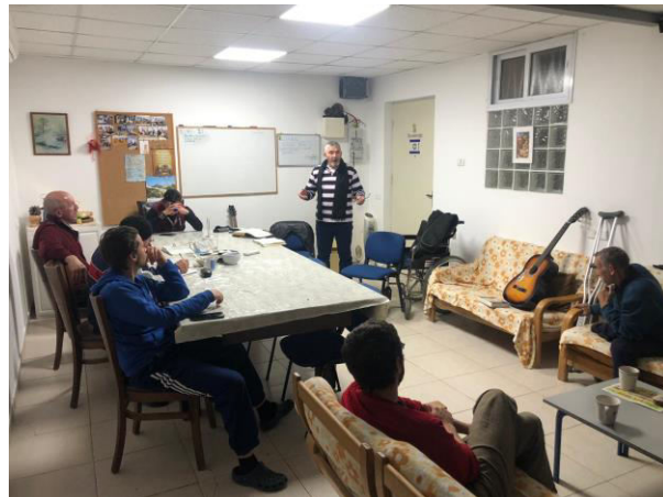
Bibelgesprächskreis in der Reha, geleitet von einem Gastredner.